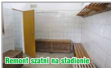
Remont szatni na stadionie