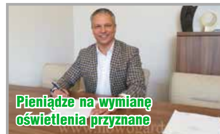
Pieniądze na wymianę oświetlenia przyznane