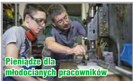
Pieniądze dla młodych pracowników