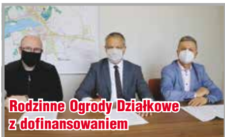
Rodzinne Ogrody Działkowe z dofinansowaniem