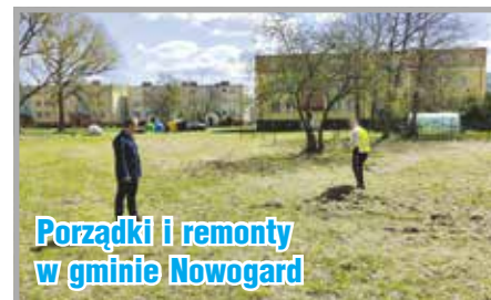
Porządki i remonty w gminie Nowogard