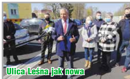
Ulica Leśna jak nowa