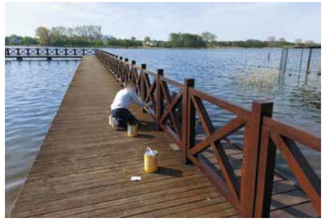
Czyszczenie i malowanie mola