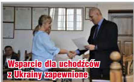
Wsparcie dla uchodźców z Ukrainy zapewnione