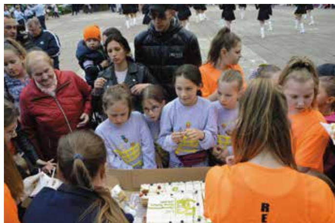
Pół wieku Nowogardzkiego Domu Kultury za nami, był tort na placu Wolności