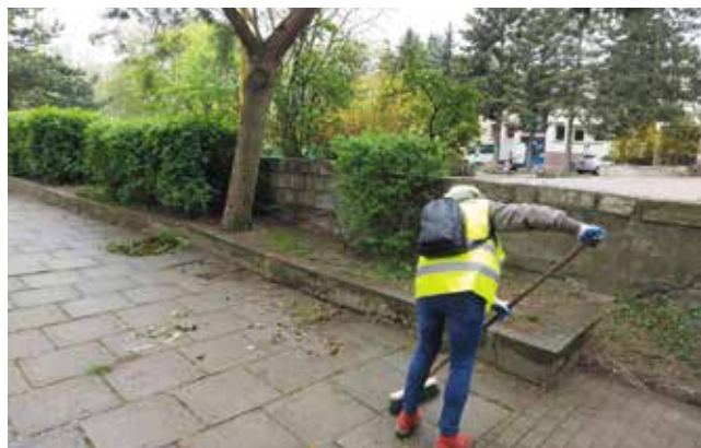
Porządki za pomnikiem