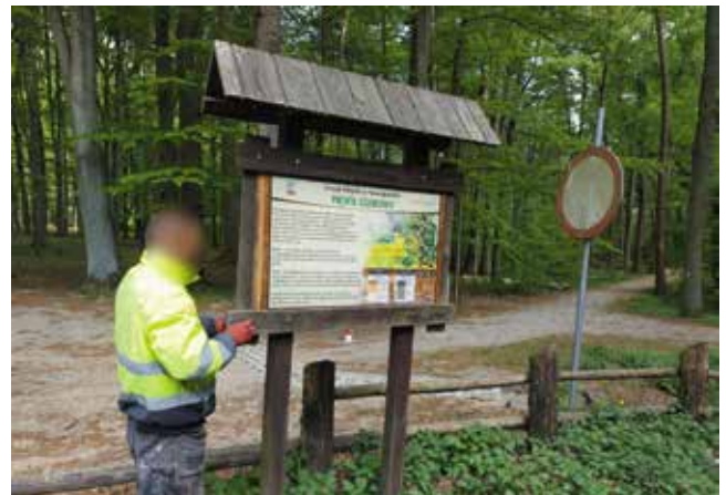
Naprawa, malowanie tablic informacyjnych - ścieżka nad jeziorem, „Sarnilas”