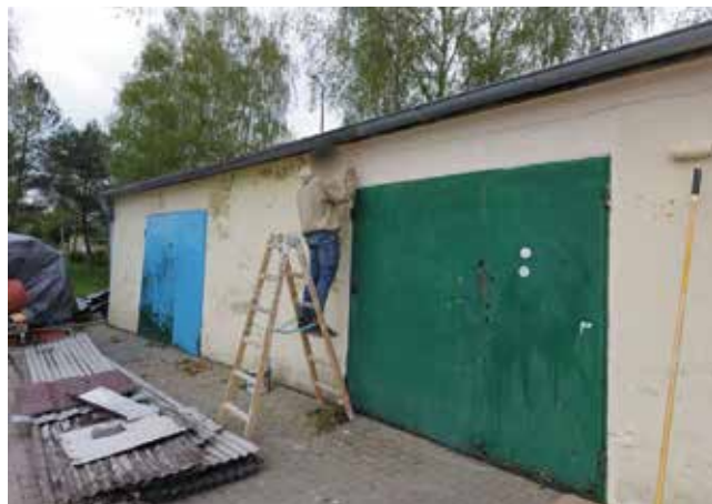
Malowanie budynku i pomieszczeń klubu żeglarskiego Knaga