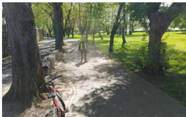
Sprzątanie ścieżki pod murami