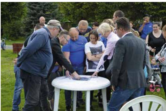
W Bieniczkach powstanie świetlica. Mieszkańcy wsi dali zielone światło