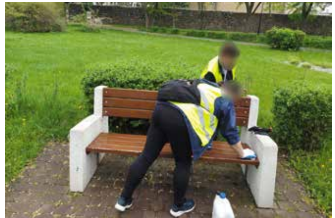
Mycie ławek nad jeziorem