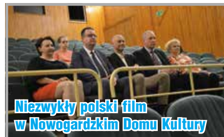
Niezwykły polski film w Nowogardzkim Domu Kultury