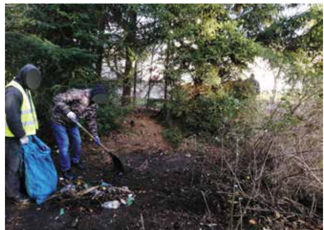
Usuwanie dzikiego wysypiska z zieleńców na ul. Księcia Racibora