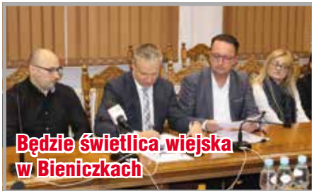
Będzie świetlica wiejska w Bieniczkach