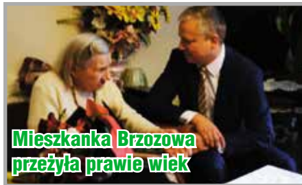
Mieszkanca Brzozowa przeżyła prawie wiek