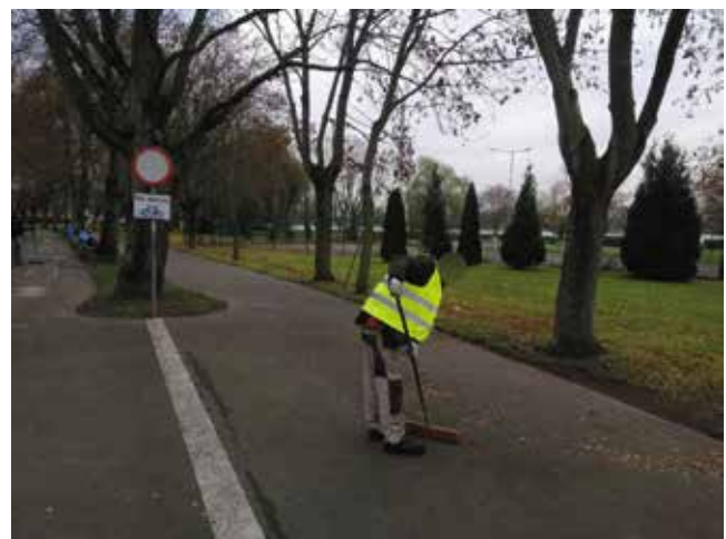
Porządki na ścieżce pieszo-rowerowej przy murach obronnych