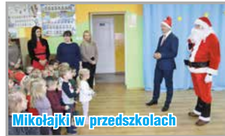
Mikołajki w przedszkolach