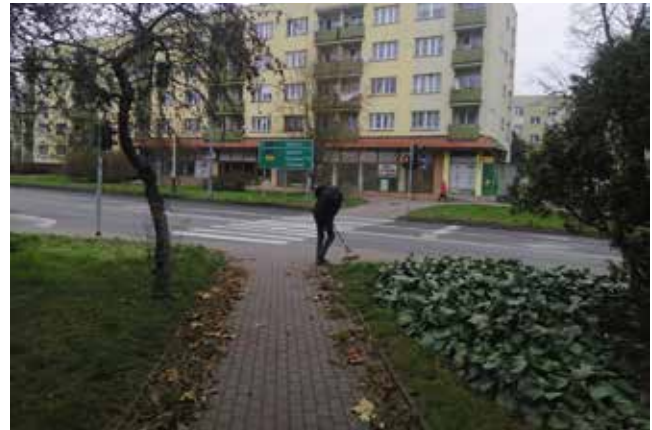
Grabienie liści i porządki - plac Ofiar Katynia